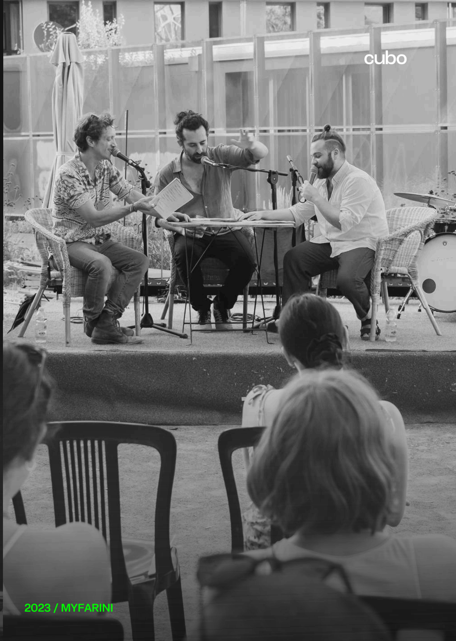
2023 / MYFARINI