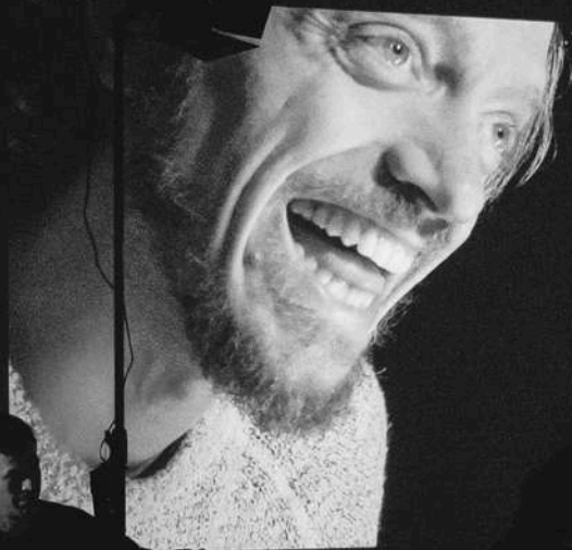
2025 / LOMBROSO16