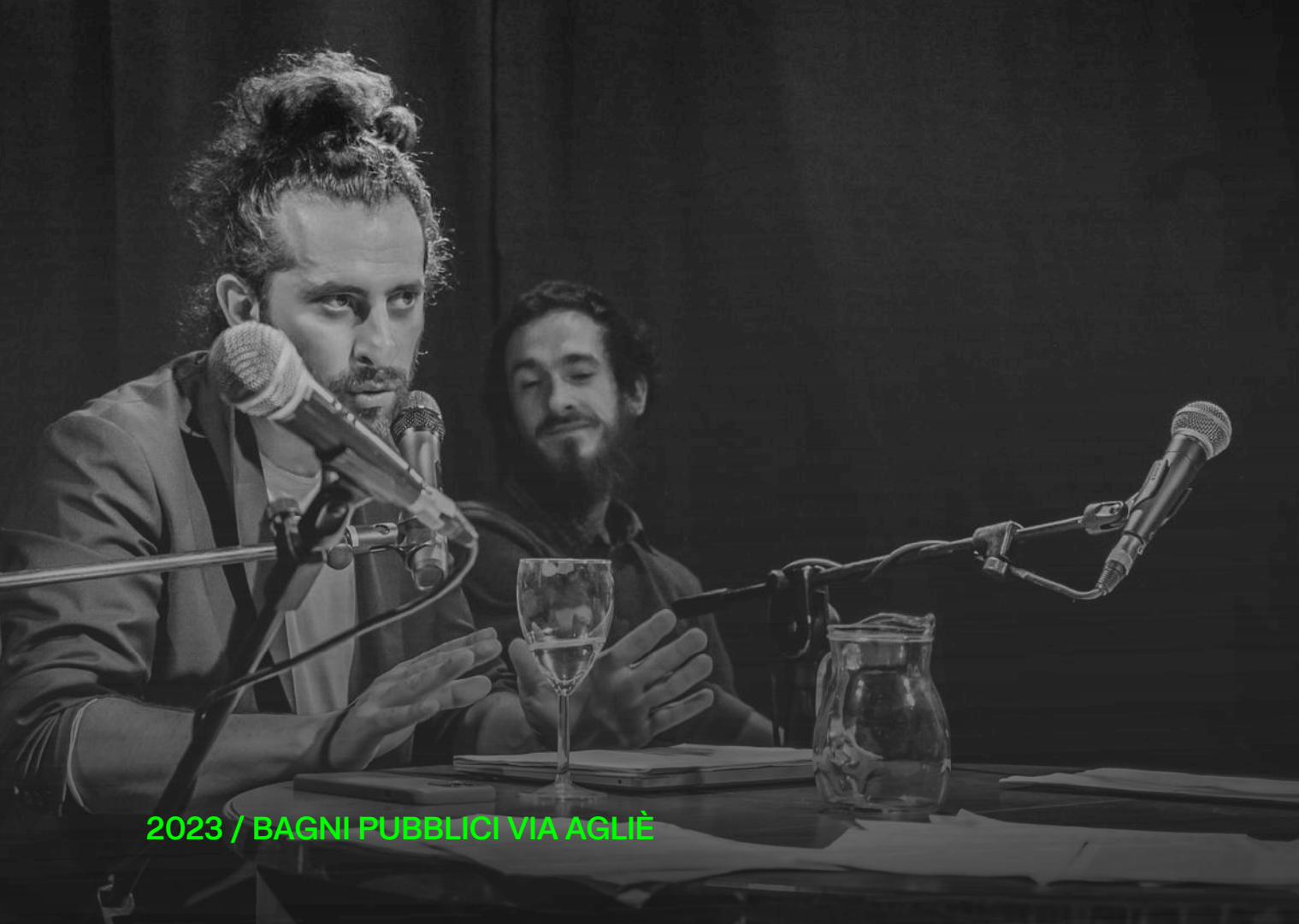
2023 / BAGNI PUBBLICI VIA AGLIÈ